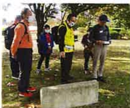
元は大きな墳丘だったと 言われる原山古墳