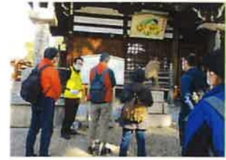
八幡宮は応神天皇が祭神