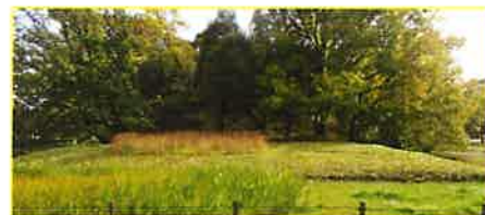
帆立貝形古墳の孫大夫山古墳