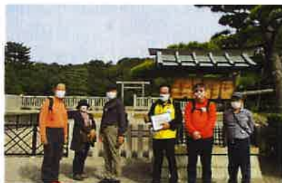
百舌鳥耳原中陵 (仁徳天皇陵)