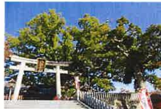
樹齢800年と言われる大楠。府の天然記念物

大久保利通の三男。 明治大正の官僚・議員。 鳥取、大分、埼玉、大阪の 知事も歴任