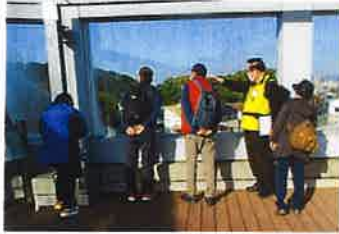
三国ヶ丘駅屋上 (みくにん広場)

ルート③ 百舌鳥八幡宮～御廟山古墳～いたすけ古墳～大仙公園ビジターセンター～大仙公園茶室