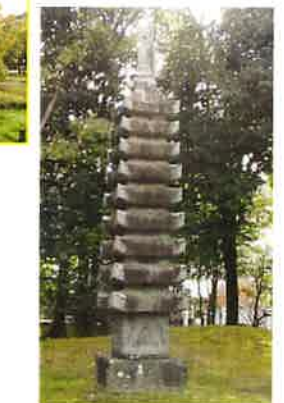
黄梅庵の庭の九重の塔