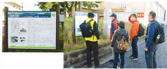
阪和線沿いの見落としそうな鏡塚古墳