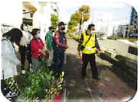
与謝野晶子生家前