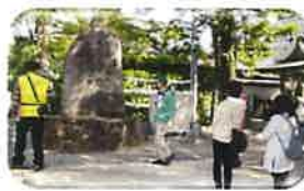
泉陽高校発祥の地の碑